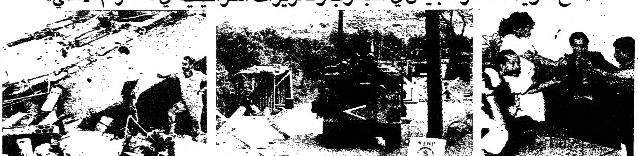
تعزيزات عسكرية اسرائيلية اخذت الى الحزام الامني (تزيه تلويزي)